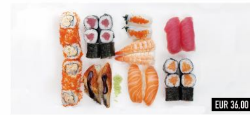
99. Sumo Mix (Für 2 Personen) Nigiri: 2 Lachs, 2 Unagi, 2 Thunfisch, 2 Ebi, 2 Ika Maki: 6 Lachs, 6 Thunfisch, 6 Osaka