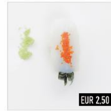
62. Ika Tintenfisch