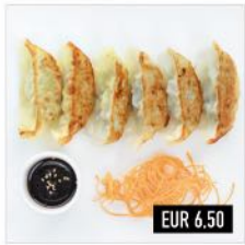
05. Gyoza Knusprig gebratene Teigtaschen mit Hähnchen & Gemüse