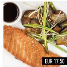
29. Lachs Teriyaki Schottisches Lachsfilet mit knackigem Gemüse, Teriyaki-Sauce & Reis