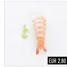
60. Ebi Garnele