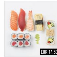
96. Ninja Mix Nigiri: Ebi, Thunfisch, Lachs, Tamago Maki: 3 Lachs, 3 Thunfisch, 3 Vegetarian