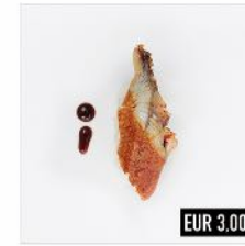
61. Unagi Gegrillter Aal