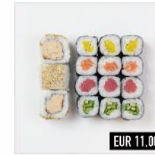
95. Maki Mix 3 Lachs, 3 Gurke, 3 Thunfisch, 3 Rettich, 3 Tunamayo