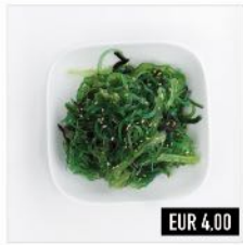
02. Wakame Salat (v) Eingelegter Algensalat mit Sesam