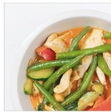
Ninja Curry scharf Rotes Curry mit Gemüse, Kokosmilch, Erdnüssen & Reis

19. vegan (v) EUR 10,50 20. mit Hähnchen EUR 12,50