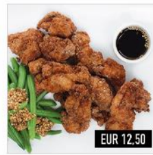
Karaage oder Kombo Knuspriges Hähnchen mit Karaage- Sauce, Zitrone, Bohnen & Reis

19. vegan (v) EUR 10,50 20. mit Hähnchen EUR 12,50