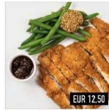
23. Chicken Katsu Knuspriger Hähnchenschenkel ohne Knochen mit Katsu-Sauce, jap. Senf, Bohnen & Reis