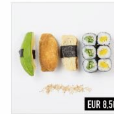
97. Vegetarian Mix (v) Nigiri: Inari, Tamago, Avocado Maki: 3 Gurke, 3 Rettich