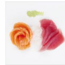
Sashimi Lachs oder Thunfisch

40. 8x Lachs EUR 9,50 41. 8x Thunfisch EUR 11,50 42. Gemischt EUR 10,50