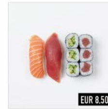
98. Mini Mix Nigiri: Lachs, Thunfisch Maki: 3 Thunfisch, 3 Gurke