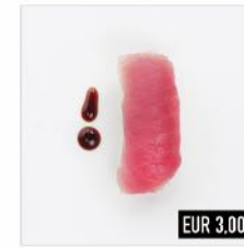
59. Maguro Thunfisch