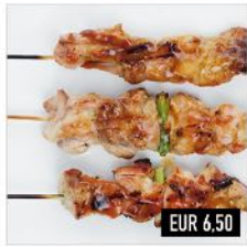
04. Yakitori Drei gegrillte, marinierte Hähnchenspieße