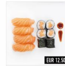
93. Sake Mix 6 Lachs Maki, 4 Lachs Nigiri