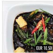
25. Sweet Vegan Tofu (v) Knuspriger Tofu, Aubergine, Bohnen & Reis (scharf & süß)