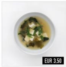
01. Misoshiru (v) Misosuppe mit Wakame, Tofu & Lauchzwiebeln