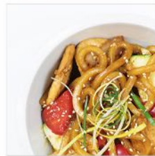
Yaki-Udon Gebratene, frische Weizen- nudeln mit Gemüse & Ei