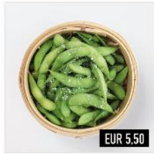
06. Edamame (v) Gekochte und gesalzene japanische Bohnen