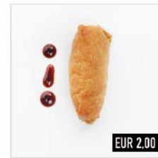
64. Inari (v) Mit Reis und Sesam gefüllte Tofutasche