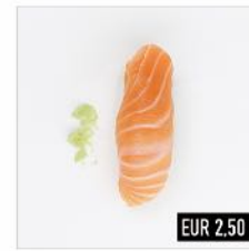
58. Sake Schottisches Lachsfilet