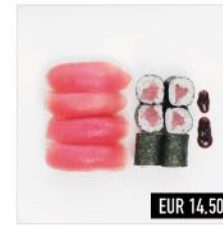
94. Maguro Mix 6 Thunfisch Maki, 4 Thunfisch Nigiri