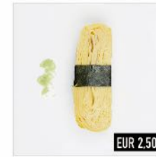
63. Tamago (v) Hausgemachtes, leicht süßes Omelett aus Bio-Eiern Hof Alpernhöhe, Nümbrecht