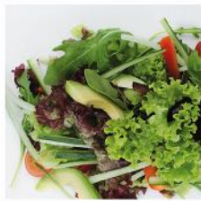
Gemischter Salat Avocado, Tomate, Gurke, Paprika und Sesam-Dressing