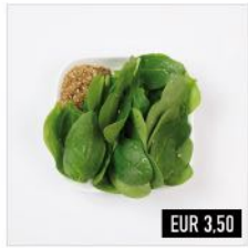
03. Horenso Gomaae (v) Frischer Baby-Blattspinat mit süßer Sesam-Sauce