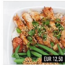
26. Chicken Teriyaki Gegrilltes Hähnchen in Teriyaki-Sauce mit Bohnen & Reis