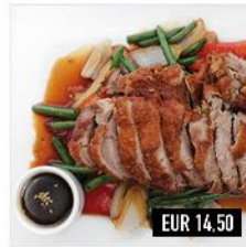
22. Kamo Teriyaki Marinierte, knusprige Ente in Rotwein-Teriyaki-Sauce mit knackigem Gemüse & Reis

21. Karaage 24. Kombo (2x Yakitori & Karaage)